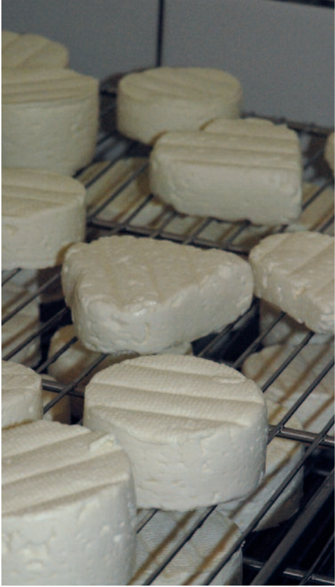
Hier reift der Camembert.