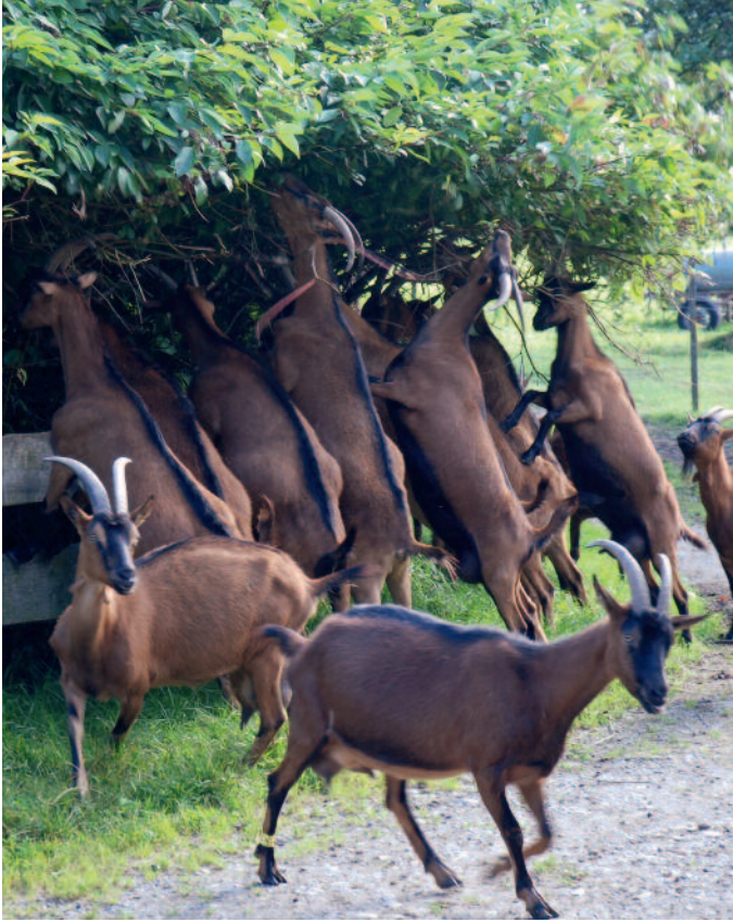
Ziegen lieben die Blätter von Büschen.